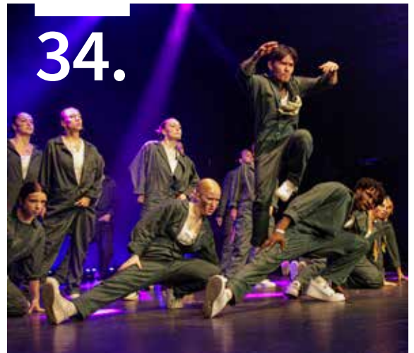
Impressionen vom Hip Hop-Bayern Cup