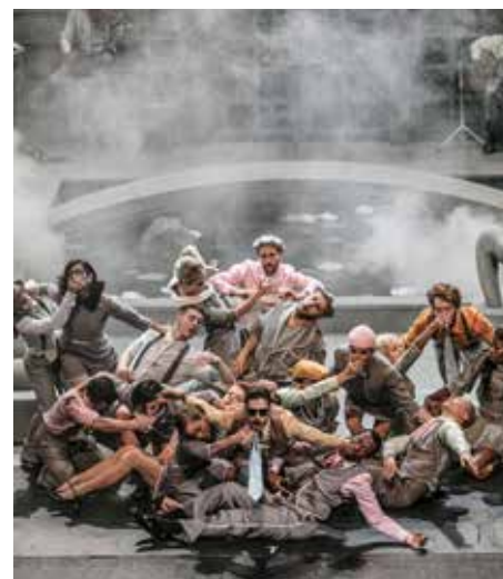
„Stoic” (Göteborg Ballet) Ch. Sidi Larbi Cherkaoui