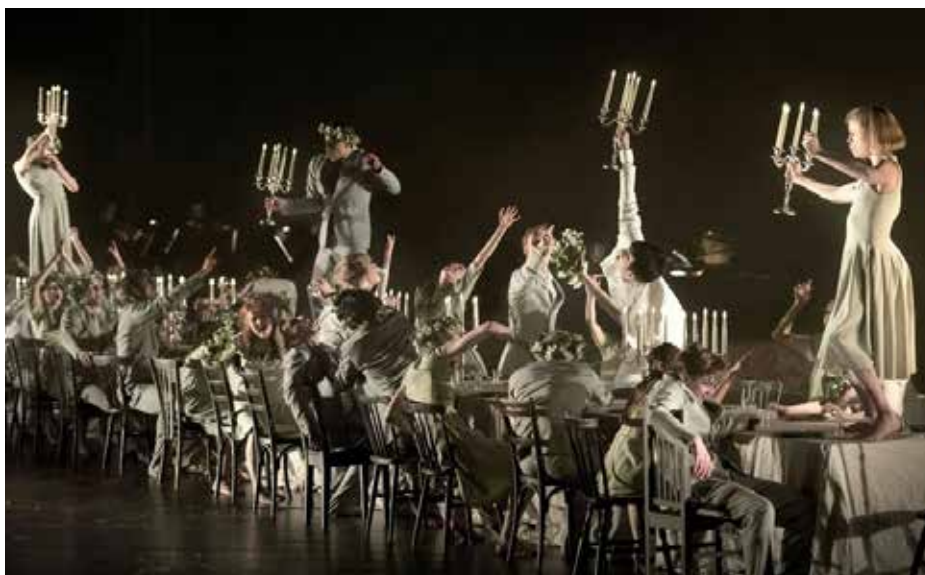
"Midsummer Night's Dream" Ch. Alexander Ekman © The Royal Swedish Ballet

www.theater-kiel.de 13,15,22.02;08.03 Eugen Onegin Ch. Yaroslav Ivanenko 20,29.02;01.03 La Sylphide Ch. August Bournonville 13.03 Creation Ch. Georg Reischl / Yaroslav Ivanenko