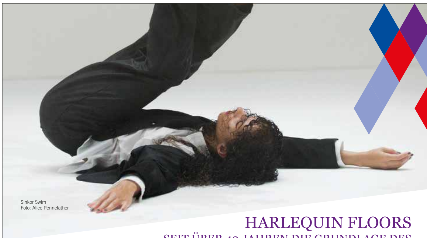
Sinkor Swim