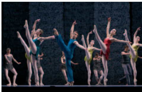
National Ballet of Canada, In Colour